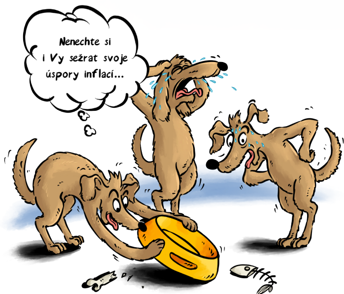
ČÁSTKA NA BĚŽNÉM ÚČTĚ, ČI DOMA 100.000,-

V prvním čtvrtletí roku 2022 se očekává meziroční inflace k 8%, možná až k 10%. Potom ekonomové předpokládají, že by inflace mohla klesat. Pro ochranu financí proti inflaci dnes existuje řada nástrojů. Ať jsou to různé typy dluhopisů, nemovitostní fondy či komodity. Rádi vám v tom poradíme.